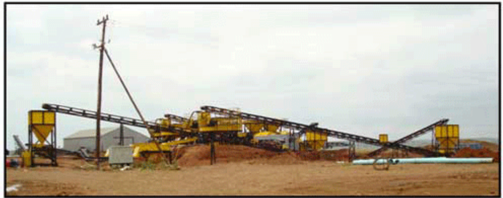
Installation of new pan plant facilities at the Tirisano mine site

Etruscan Resources Inc. hält 53,7% Anteile an Etruscan Diamonds, Mountain Lake Resources Inc. (TSXV: MOA) hält 16,2% der Anteile und andere dritte Parteien halten 30,1% der Anteile. Etruscan Diamonds hält einen 74%igen Anteil am Blue Gum Projekt, die verbleibenden 26% werden von Etruscan Diamonds schwarzem Beteiligungspartner, der Mogopa Minerals (Pty) Ltd. gehalten.