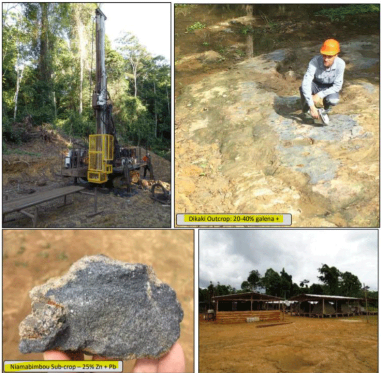
Figure 1: Diamond drill rig commencing Hole 1 (top left); Dikaki embayment with 20-40% galena and sphalerite (top right); Mineralised sub-crop at Niamabimbou (25% Zn+Pb) (bottom left), and the Exploration Camp near Dikaki (bottom right)

Im ersten Schritt will die Firma zunächst 1.000 Bohrmeter mit Diamantkernbohrungen niederbringen. Dikaki und Bouambo East sind die ersten beiden Ziele von höchster Priorität, die angebohrt werden: