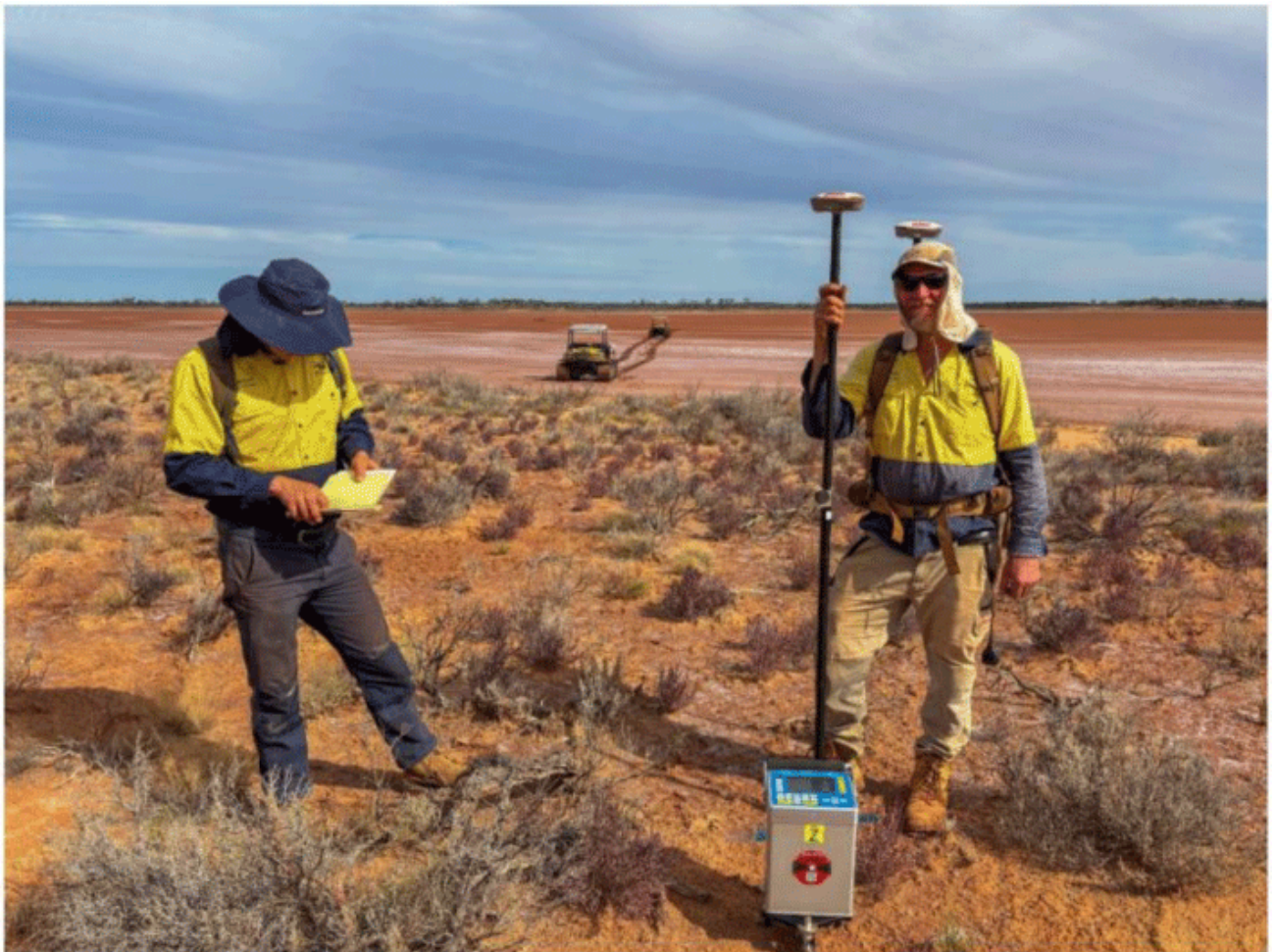
Plate 4: AngloGold Ashanti undertaking gravity surveys at Lake Carey (M39/411)

Der Goldproduzent ist aktiv auf den Gebieten, was positiv zu werten ist. Laut dem jüngsten Quartalsbericht wurden Gravitationsmessungen durchgeführt und es wurden Arbeitsprogramme für alle der fünf Konzessionen beantragt und genehmigt.